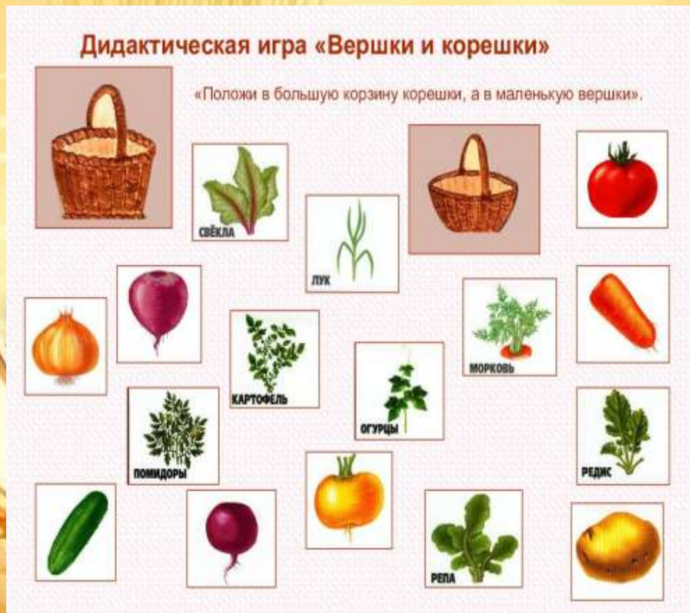
«Вершки и корешки».