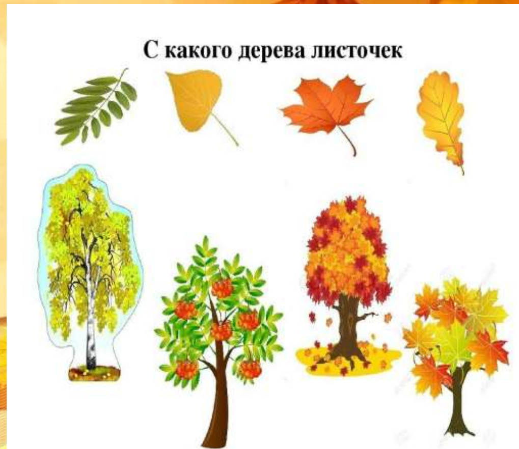
« С какого дерева листок»